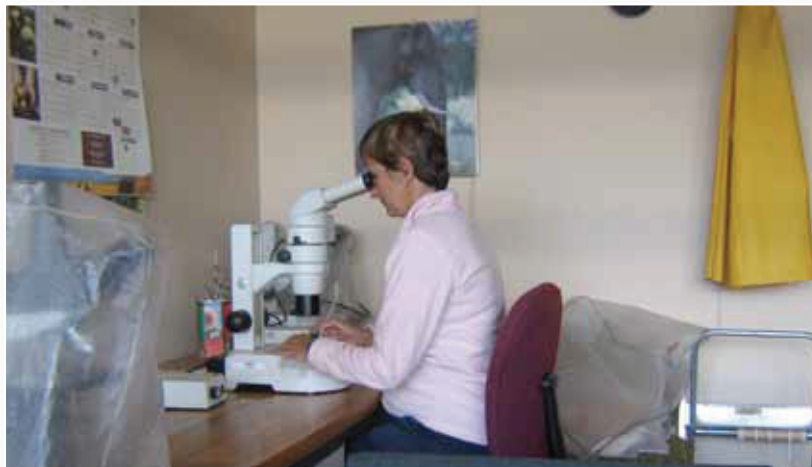
Fig 10. Die aalwurms wat uit die monsters uit geekstraer is, word geidentifiseer en getel. Nematodes extracted from the samples will be identified and counted.