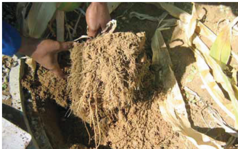
Fig 2. As daar baie meer as 200 cm 3 grond teenwoordig is, kan die oortollige grond liggies afgeskud word. Access soil (more than 200 cm 3 ) can be removed by carefully shaking it off the root system.