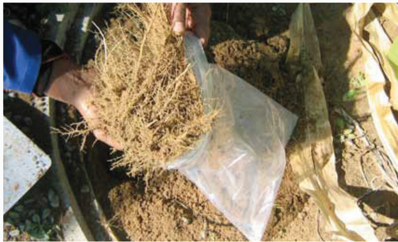
Fig 6. Plaas die wortelstelsel met die grond in 'n plastieksak. Place the root system together with the soil in a plastic bag.