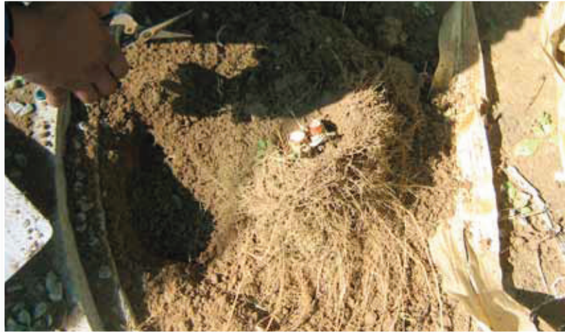
Fig 5. Dis net die wortelstelsel en grond wat van belang is, die bogrondse gedeeltes van die plant kan afgesny word. Only the root system and the soil will be used in the extraction, the above ground parts of the plant can be removed.