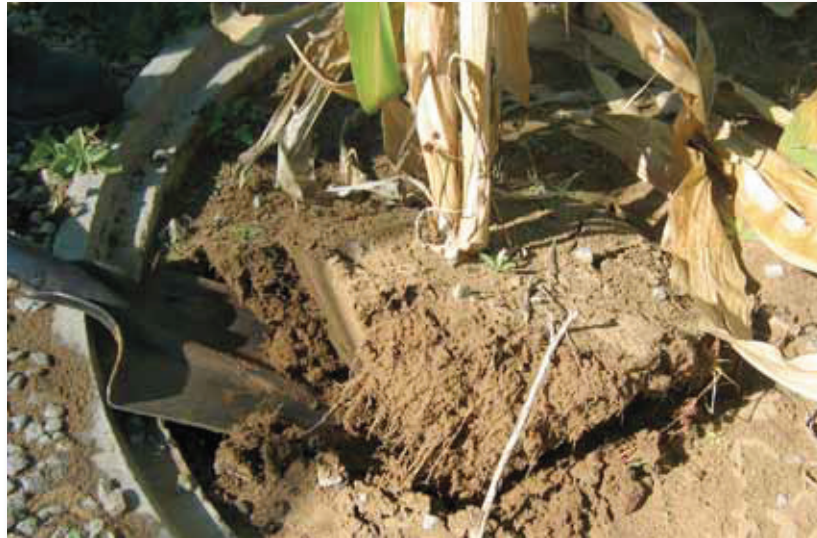
Fig 1. Spit die wortelstelsel met grond rondom uit. Remove the plant with the soil intact around the roots.