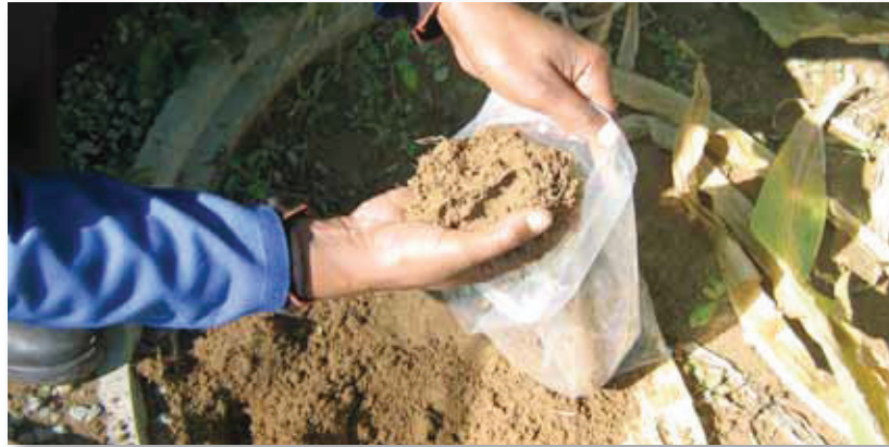
Fig 3. As daar nie genoeg grond rondom die wortelstelsel is nie, skep nog bietjie met die hand uit waar die plant uitgespit was en plaas dit in 'n plastieksak. If there is not enough soil present around the root system additional soil can be sampled in the spot where the plant was removed and placed in a plastic bag.