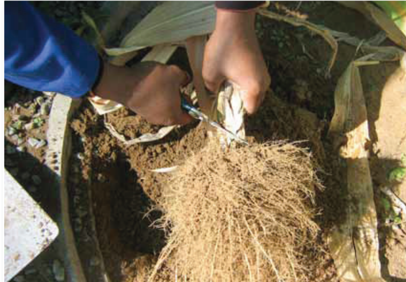
Fig 4. Knip die bogrondse gedeelte van die plant af. Remove the above ground parts of the plant.