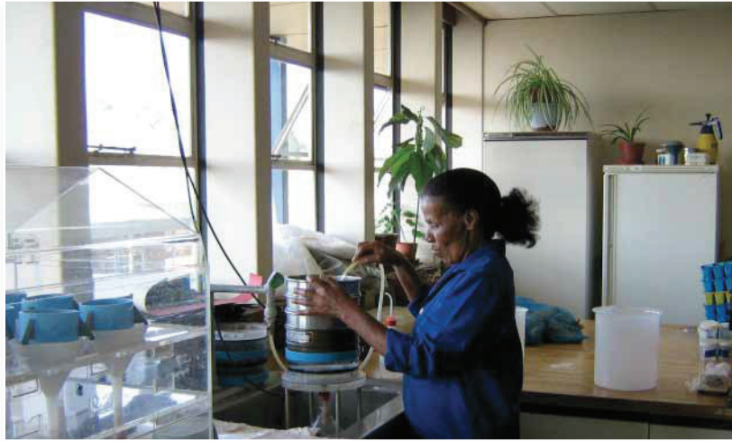
Fig 9. Aalwurms word uit die grond en wortels geekstraer deur van spesifieke tegnieke gebruik te maak. Nematodes will be extracted from the soil and roots using specific techniques.