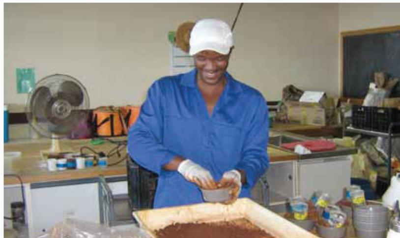
Fig 8. Wortels en grond word verwerk voordat die aalwurms daaruit geekstraer kan word. Roots and soil will be processed before the nematodes are extracted.